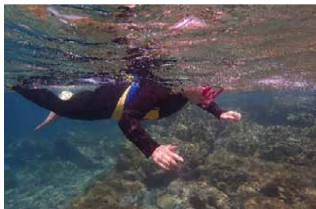
シュノーケリング