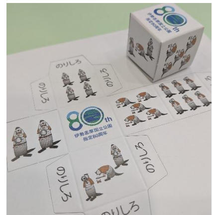
サイコロ (ペーパークラフト)