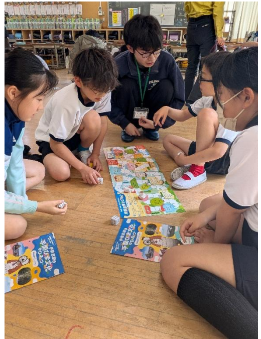
学生とすごろくを楽 む子どもたち。ワイワイ ガヤガヤ！