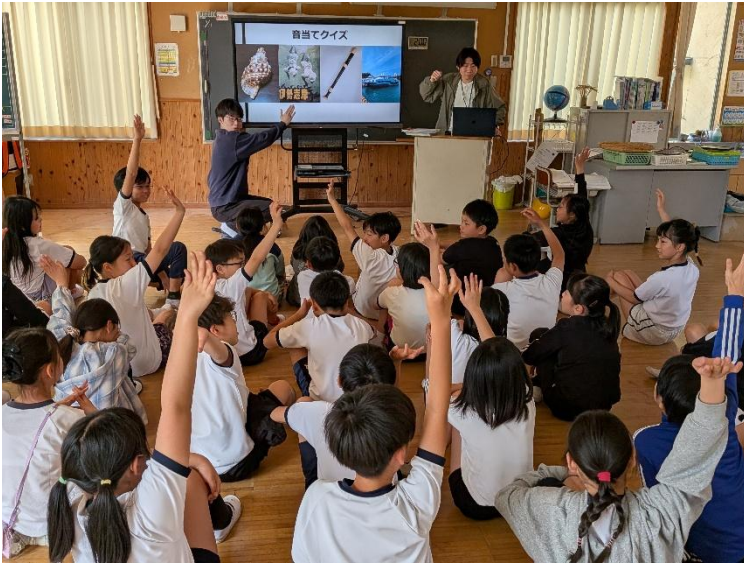
音当てクイズ。 大変盛り上が っていました！