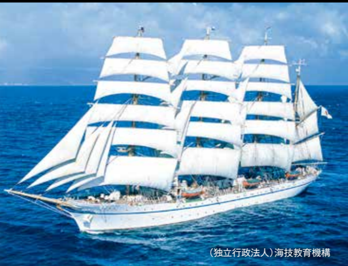
(独立行政法人)海技教育機構